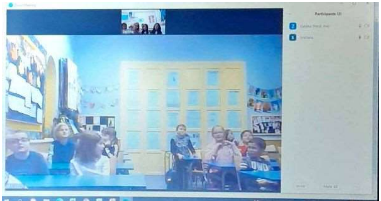
CS Scanned with CamScanner