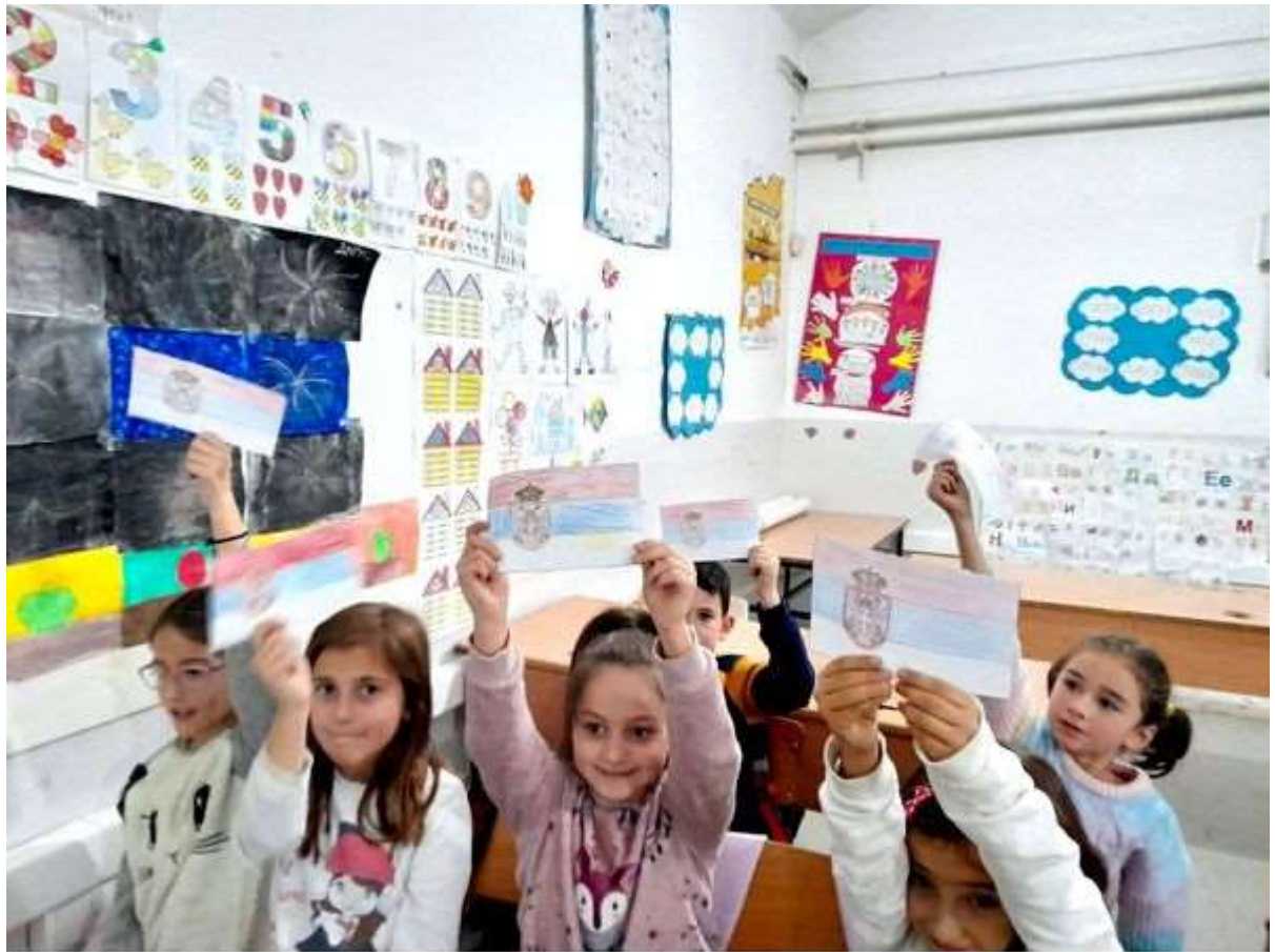
CS Scanned with CamScanner